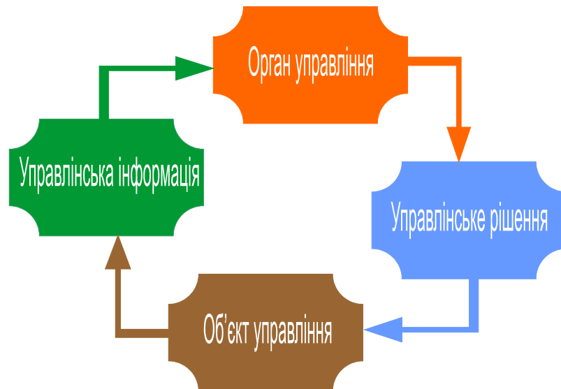
Рис.2.2. Прийняття управлінського рішення (загальна блок-схема)